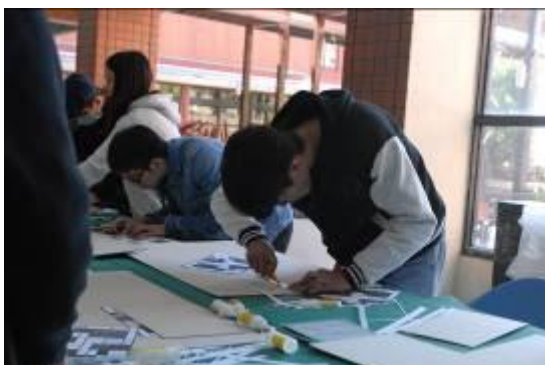
學員上課實際操作情形