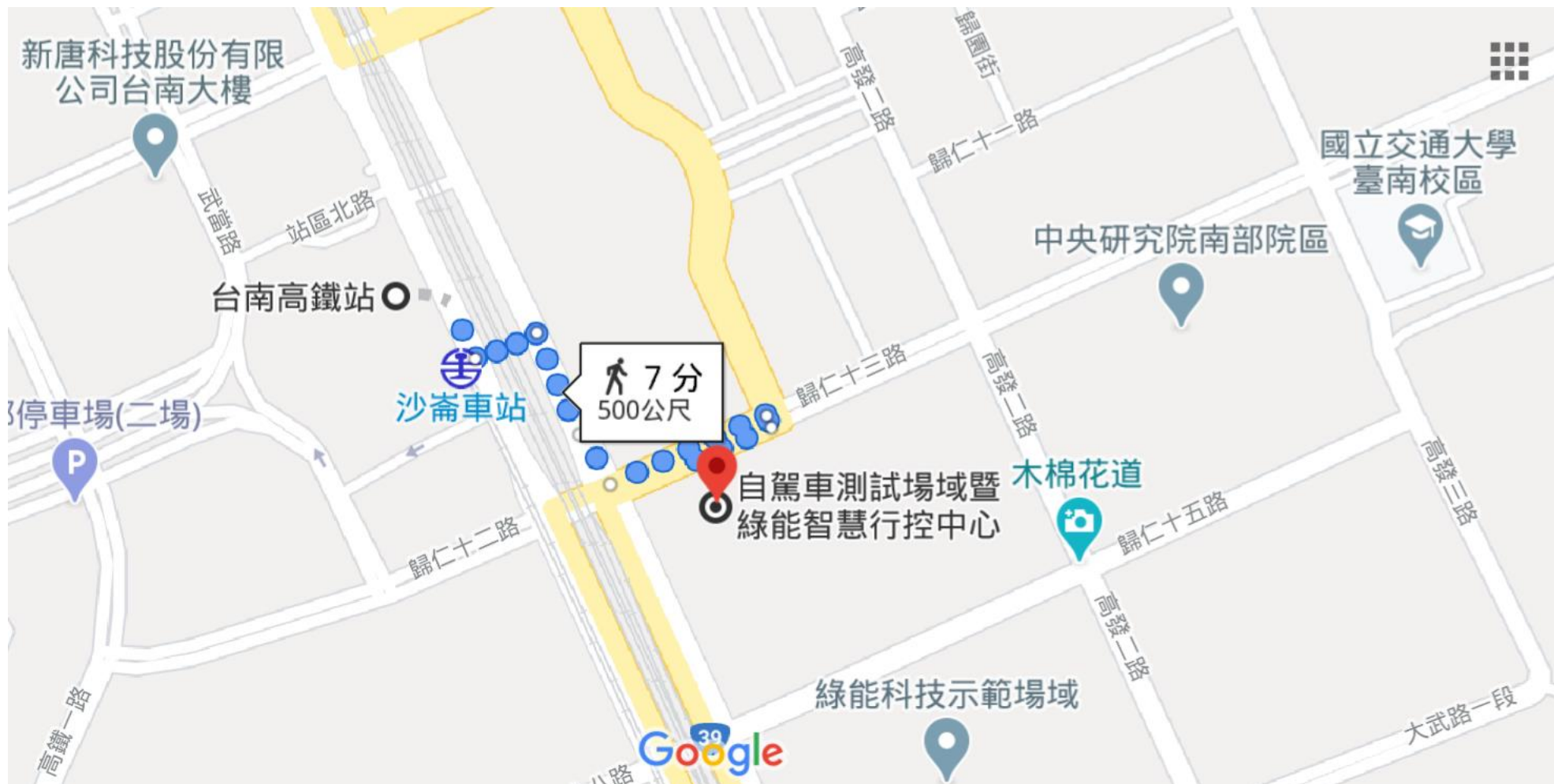
臺灣智駕測試實驗室 (沙崙自駕車場域) 位置