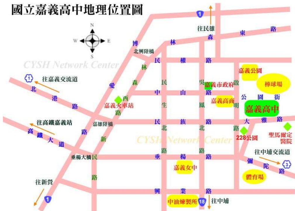
國立嘉義高中地理位置圖